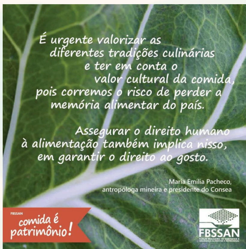
Exemplo de um dos cards com pensamentos-pimenta que foram impressos e distribuídos durante a primeira fase da campanha.

A primeira fase nasceu da força simbólica dos chamados pensamentos -pimenta : pequenos fragmentos de palavras, frases e imagens, curtos e diretos, mas com intensidade para gerar reflexões. A inspiração veio de Rubem Alves (2012) que comparou as pimentas com as ideias, pois ambas podem arder e despertar os sentidos. Daí, utilizamos o pensamento-pimenta como uma linguagem artística que associa o peso das palavras e o impacto das imagens para provocar a reflexão e iluminar os sentimentos e a ação. Esses pensamentos não têm a pretensão de ensinar, mas de provocar por meio da arte. São convites à inquietação, à provocação sobre os sentidos da dimensão produtiva, à lembrança de que a comida não é neutra nem apenas funcional. Ao circular em diferentes espaços, esses materiais abriram diálogos, despertaram memórias e ajudaram a recolocar a comida no centro da conversa cotidiana, como patrimônio comum e direito coletivo.