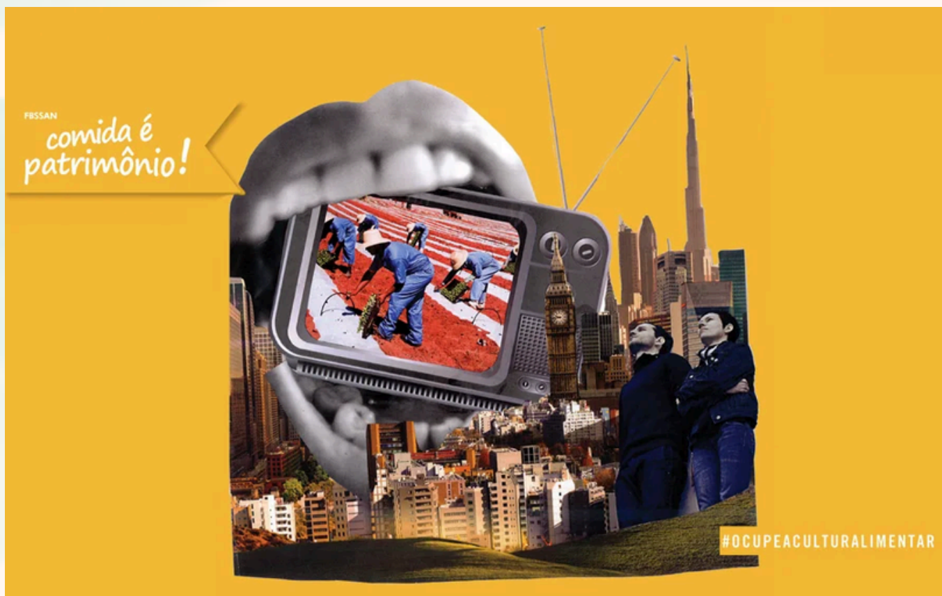
Colagem produzida durante a segunda fase da campanha.

A metodologia se apoiou na colagem como linguagem estética e política: fragmentos de imagens, palavras e texturas foram justapostos de forma intencional, criando tensões, contrastes e leituras múltiplas. Nada é linear ou fechado. Pelo contrário, cada colagem convida a novas interpretações, como se dissesse que a alimentação também é feita de camadas, contradições e disputas. Essa escolha metodológica reforça a ideia de que defender a comida como patrimônio exige criatividade, ousadia e disposição para desmontar discursos prontos.