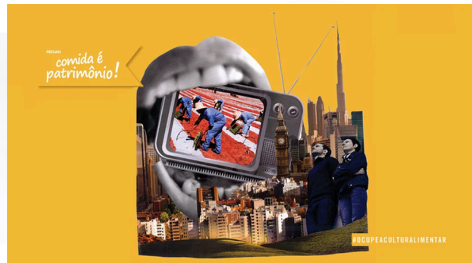
Colagem produzida durante a segunda fase da campanha.

Essa escolha metodológica reforça a ideia de que defender a comida como patrimônio exige criatividade, ousadia e disposição para desmontar discursos prontos.