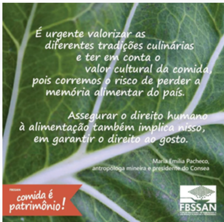
Exemplo de um dos cards com pensamentos-pimenta que foram impressos e distribuídos durante a primeira fase da campanha.

ram memórias e ajudaram a recolocar a comida no centro da conversa cotidiana, como patrimônio comum e direito coletivo.